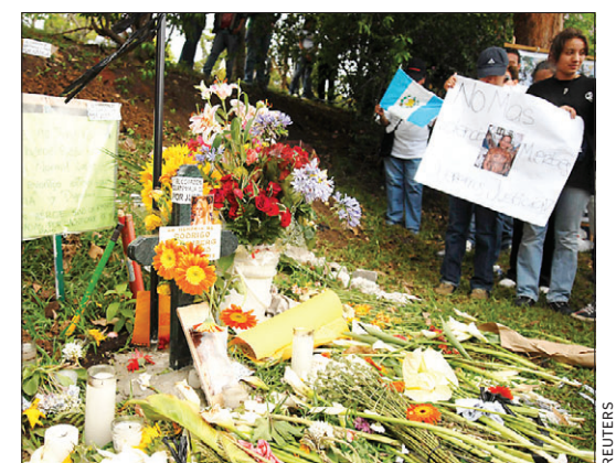
Flores en donde mataron al abogado Rosenberg.